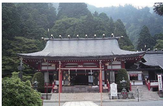
阿夫利（あふり）神社