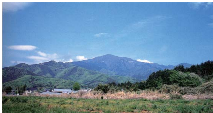
大山（神奈川県） 「川越の大山信仰」より

御師たちは江戸時代末期には160人余りいたとされています。彼らは大山山麓に居住し、参詣者のための