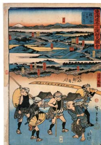
79 東海道五十三次船見合 程々社 講中儀(近代版川越) 神奈川県立歴史博物館蔵