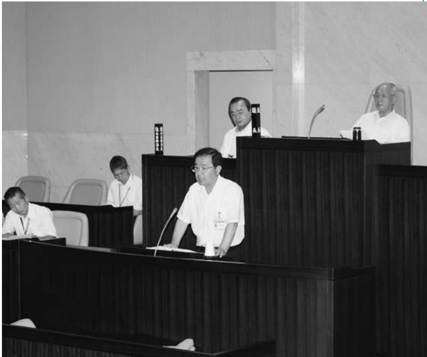
△定例会初日、議案の提出説明をする中野市長