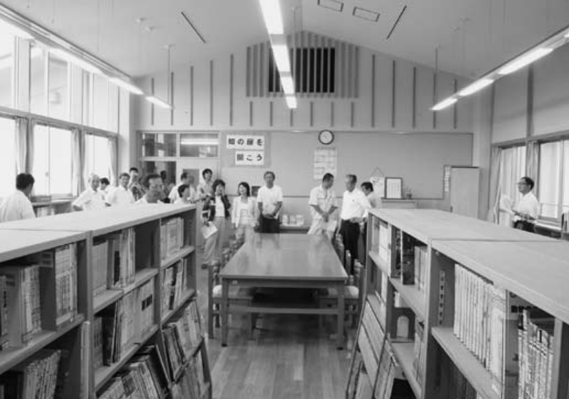
△現地調査を行い、慎重に審査（蓮田中学校図書室にて）

今定例会では、平成20年度決算認定議案11件の審査を各常任委員会に付託して行いました。予算の執行が法令に基づいて、合理的・能率的・効果的に執行されたか、また、公共の福祉向上に寄与したかなどを主眼に審査し、来年度予算編成に向けて、次のとおり指摘・要望いたしました。