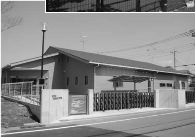
平成22年度事業として、児童施設を整備し待機児童の解消を図るため建て替えた蓮田中央学童保育所を4月から開所(上)。また、蓮田ねがやど保育園を5月に開所予定(下)。