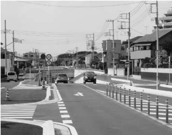
△新たに認定された市道

この路線は、都市計画道路前口山ノ内線の築造のため、完成開通に起因する市道認定であるが、工事完成後の現状及び