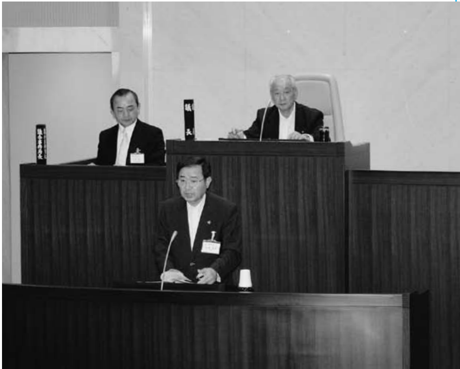
△定例会初日、議案の提案説明をする中野市長