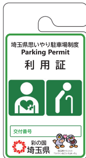
その他の高齢者、 障害者等用