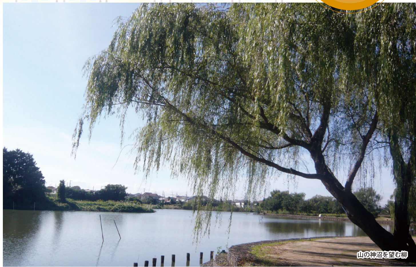
山の神沼を望む柳