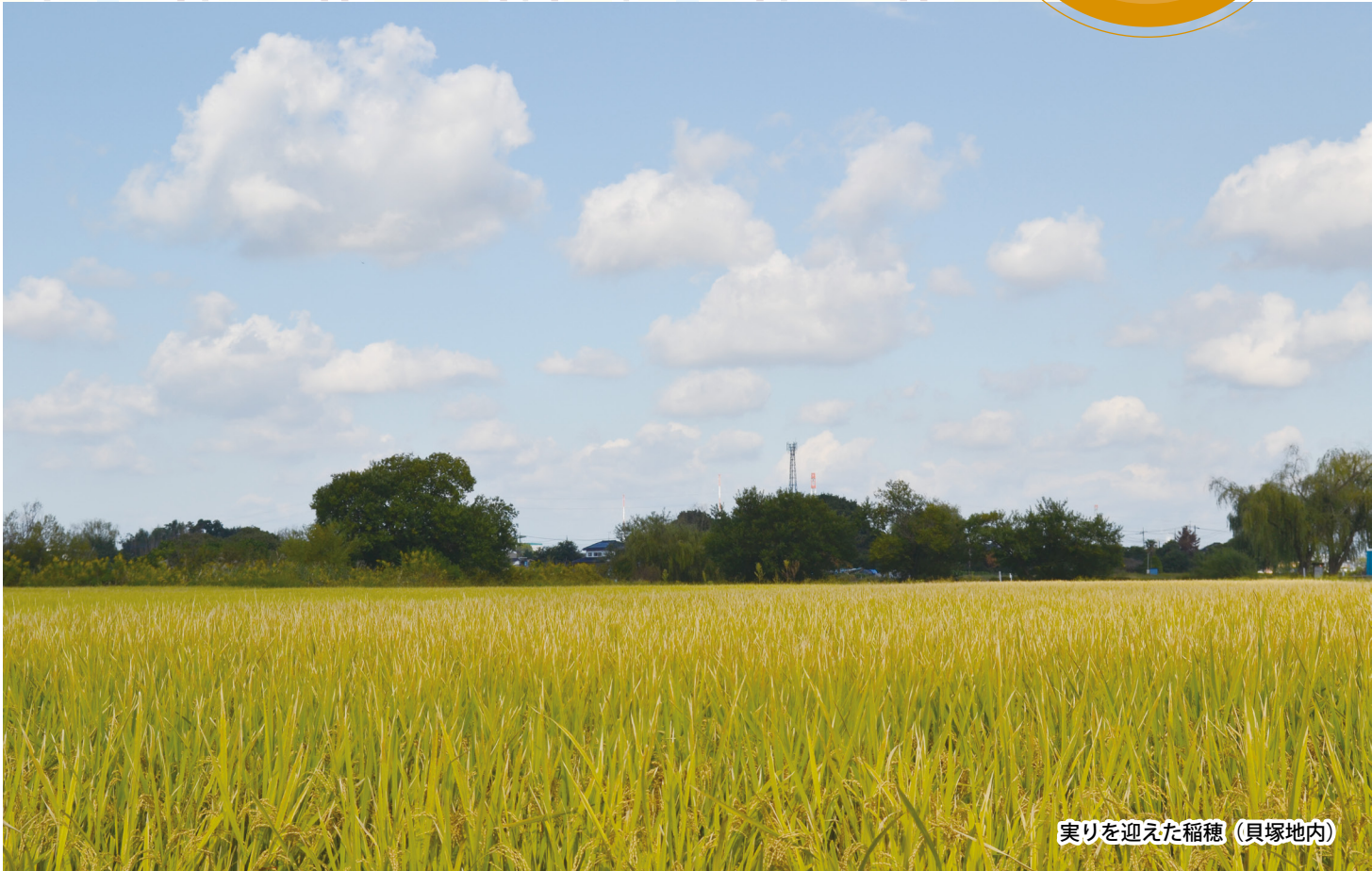
実りを迎えた稲穂 (貝塚地内)