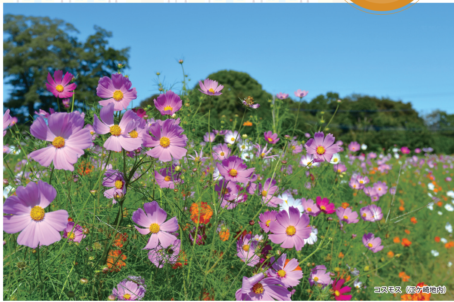
コスモス (江ヶ崎地内)