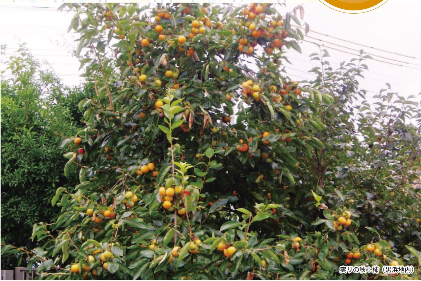
実りの秋8柿 (黒浜地内)