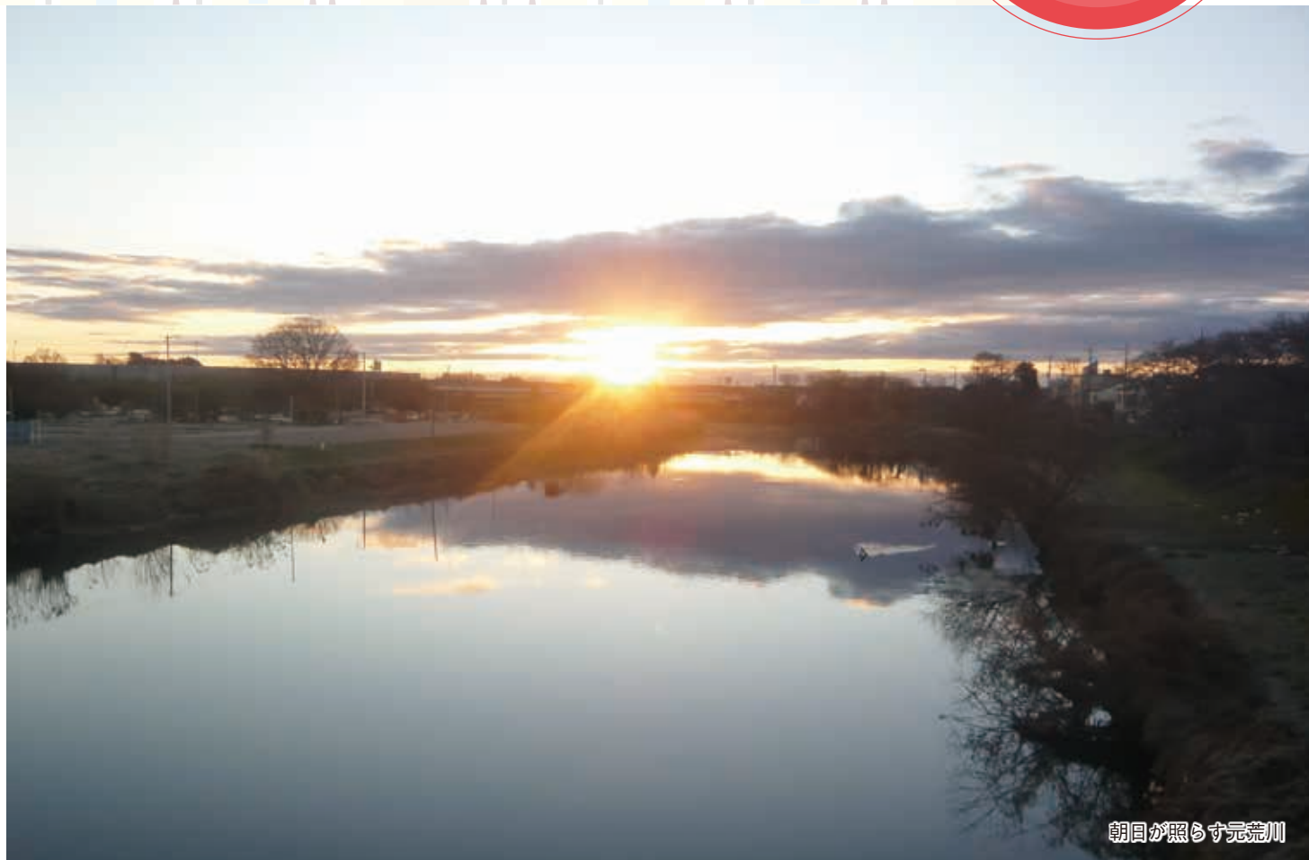
朝日が照らす元荒川