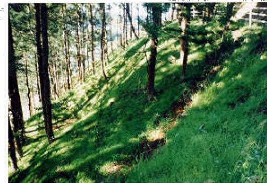
写真1. 法面整備後イメージ

法面整備につきましては、環境に優しいポリエステル繊維や砂質土を吹き付けた表層法面保護（緑化）により法面保護を実施します。なお、現況斜面に対して掘削や床掘は行いません。