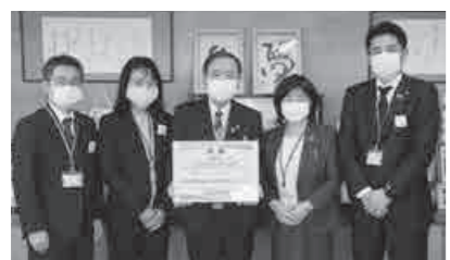
3月2日、明治安田生命保険相互会