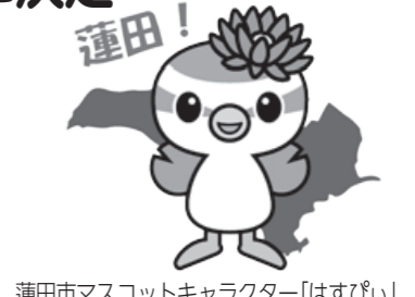
蓮田市マスコットキャラクター「はすぴい」