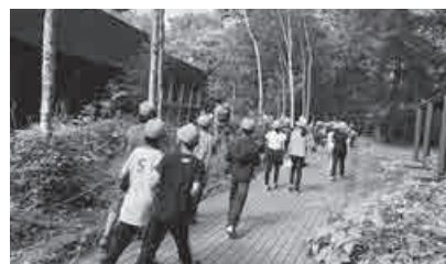
黒浜小学校ハイキング

7月中旬～下旬にかけて市内全8校の小学5年生が林間学校に行ってきました。検温・手洗い・消毒・換気の徹底など、感染症対策を講じた上で実施しました。大自然の雄大さに触れる中で、仲間とのきずなを深め、楽しく充実した体験活動を行うことができました。保護者の皆さんには、ご協力をいただきありがとうございます。