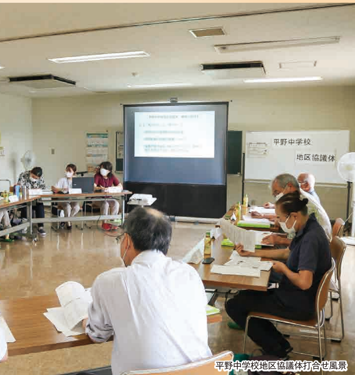
平野中学校地区協議体打合せ風景

毎年9月21日は「世界アルツハイマーデー」で9月には「世界アルツハイマー月間」です。この機会に、認知症へ関心を持ち、地域での支えあいについて考えてみませんか？