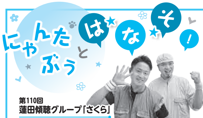
第110回 蓮田傾聴グループ「さくら」

◆ ◆ ◆ 旅行や宿泊施設のキャンセルについては、原則として旅行会社や宿泊施設の規約に従うこととなります。しかし、台風や地震などの災害時は、事業者が特別な対応を行っている場合もあるので、まずは事業者にお問い合わせをみましょう。また、予約をする前に必ず規約をよく読み、キャンセル料等、納得した上で申し込みましょう。困ったときは、蓮田市消費生活センター(消費者ホットライン188)にご相談ください。