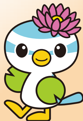
蓮田市マスコットキャラクター「はすびい」