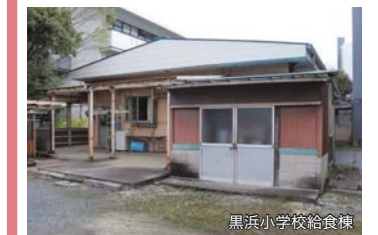
黒浜小学校給食棟