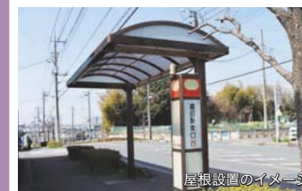
屋根設置のイメージ

★公共交通整備事業(うち、路線バス施設整備補助事業分)(都市計画課) 728万円 路線バス利用者の利便性向上のため、バス事業者によるバス停留所への屋根設置に対し、補助を行います。