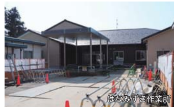
はなみずき作業所

障がい福祉施設等支援事業（うち、はなみずき作業所建設事業分）（福祉課） 8440万6千円