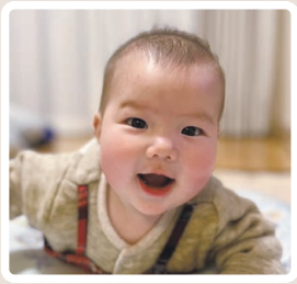
大好きなお姉ちゃんと 元気に成長してね！

令和3年以降生まれのお子さんの写真を募集中 詳しくは、広報広聴課広報広聴担当(内線)209