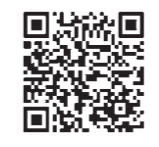
▲子育て世代包括支援センターのご案内

妊娠や出産、子育てに関する幅広い相談に対応する窓口です。保健師や管理栄養士などの専門職が相談に応じます。