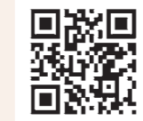
◀蓮田市母子愛育会