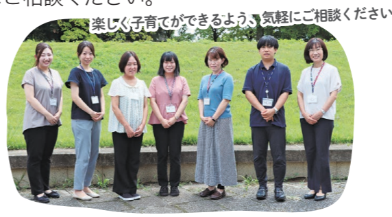
楽しく子育てができるよう、気軽にご相談ください