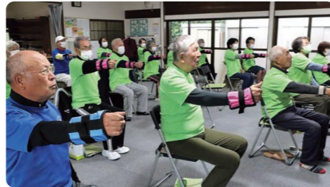
はすぴい元気体操の様子