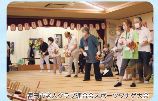
蓮田市老人クラブ連合会スポーツワナゲ大会

おおむね60歳以上のかたが活動を通して健康増進や教養の向上を図り、生きがいのある楽しい生活を送るために自主運営している会員組織です。市内には21クラブあり、グラウンドゴルフや吹き矢、清掃活動、旅行などクラブによってさまざまな活動を行っています。