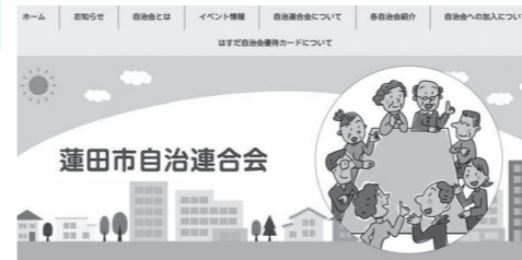
蓮田市自治連合会ホームページのトップページ

自治会のイベント情報や各自治会の紹介等が掲載されていますのでぜひご覧ください。 問合せ 自治振興課市民活動支援担当(内線)227