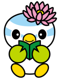
蓮田市マスコットキャラクター「はすぴい」

◆掲載している講座や行事などは、基本的に蓮田市内在住・在勤・在学のかたを対象としているものです