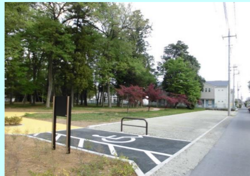
上町ふれあいの森整備