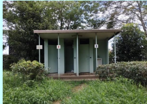
堂山公園トイレ整備 (整備中)