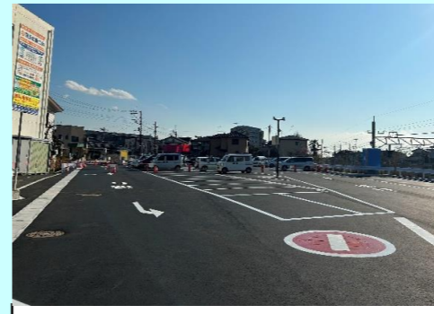
駐車場整備 (整備中)