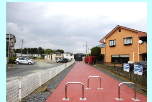
歩行者・自転車道