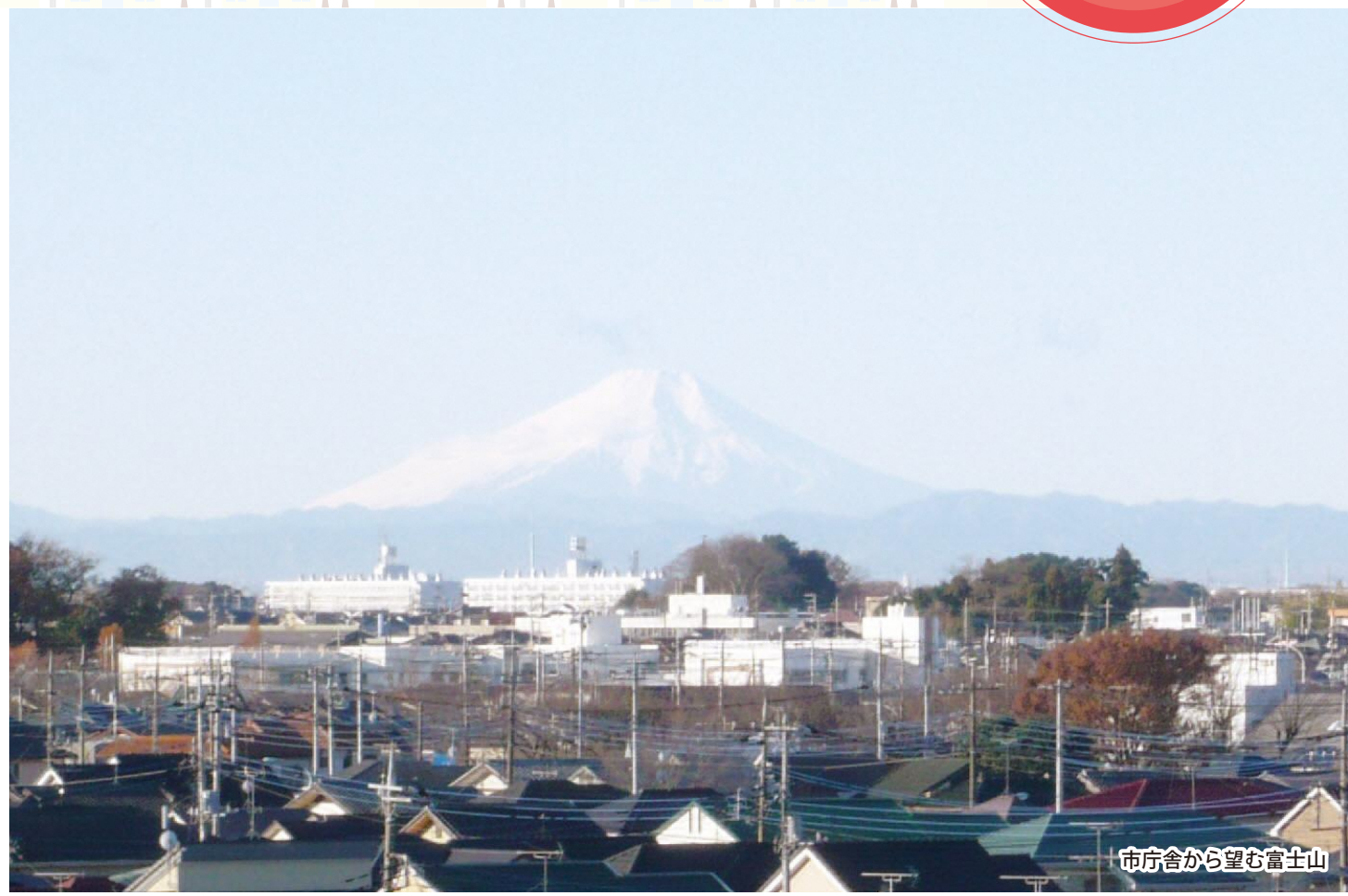
市庁舎から望む富士山