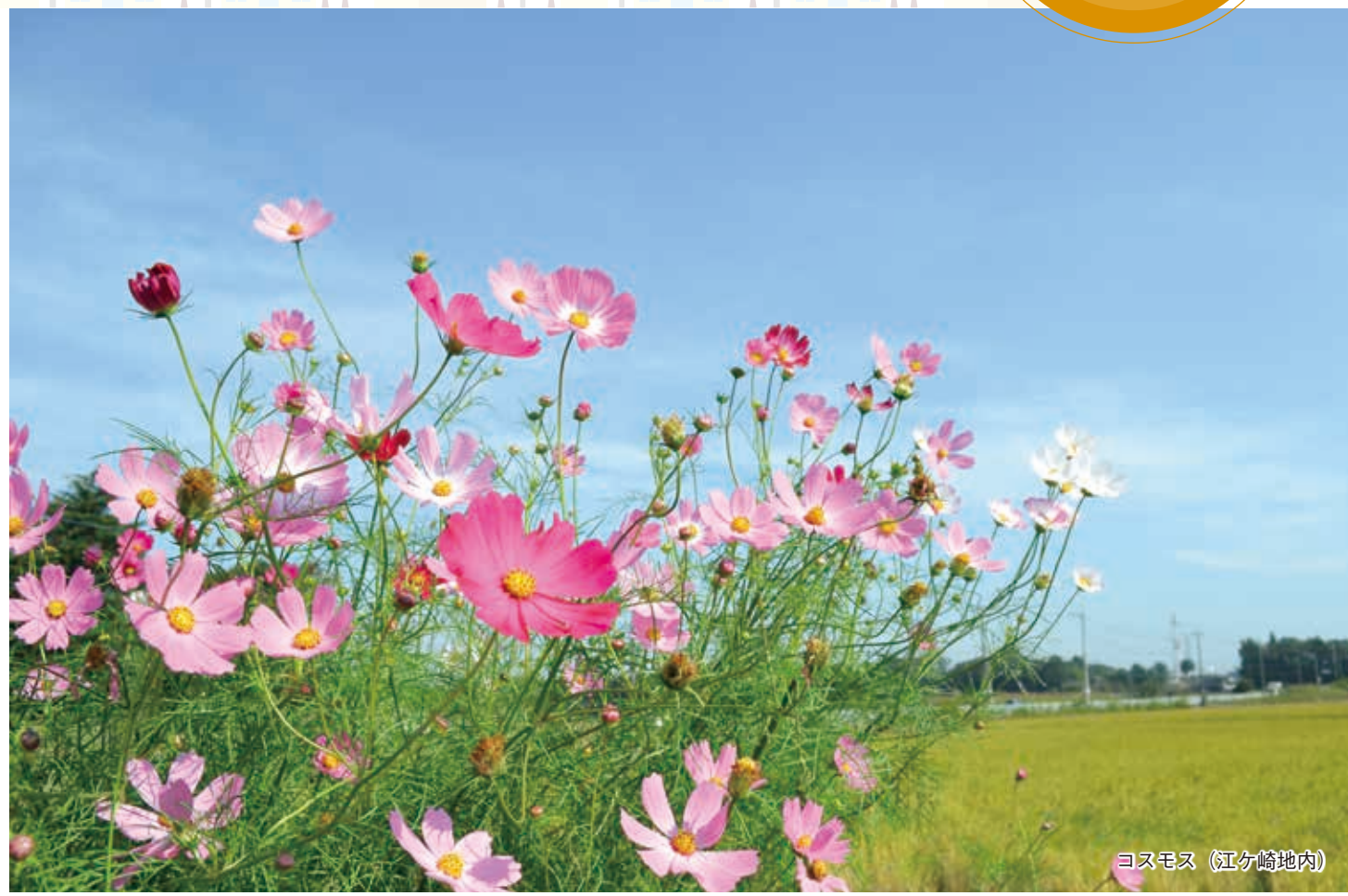
コスモス (江ヶ崎地内)