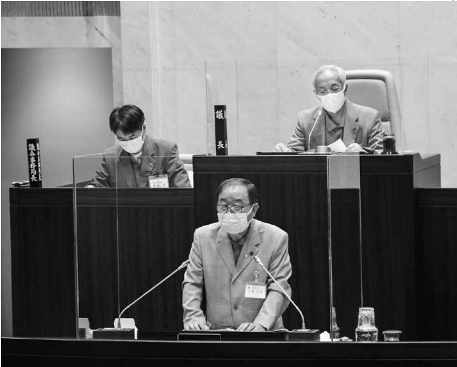
定例会初日、議案の提案説明をする中野市長

令和3年9月定例会は、去る8月30日から9月29日までの31日間の会期で開かれました。 今定例会では、市長提出議案として「令和3年度蓮田市一般会計補正予算(第5号)」「令和2年度蓮田市一般会計歳入歳出決算認定について」など22議案が上程され、いずれも可決・認定しました。