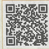
「あんしんセット」ちらし 裏面（一部抜粋）