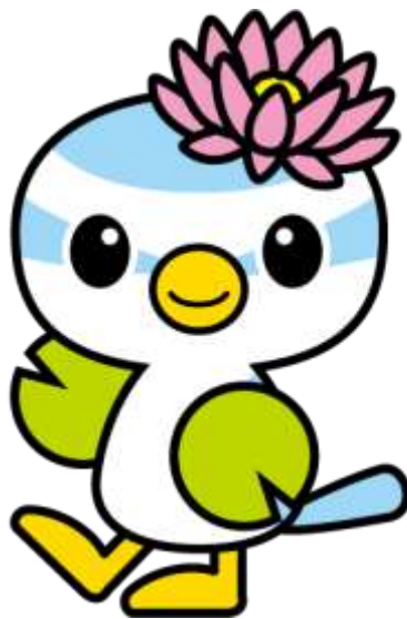
蓮田市マスコットキャラクター はすびい