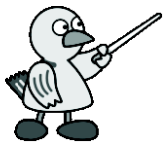
埼玉県のマスコット