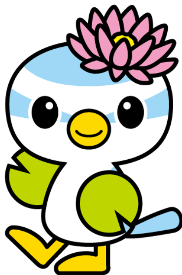
蓮田市マスコットキャラクター はすびい