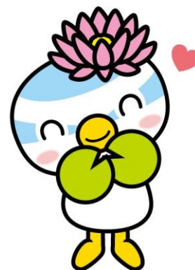
蓮田市マスコットキャラクター はずびい