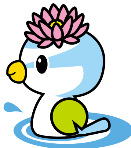
蓮田市マスコットキャラクター はすびい