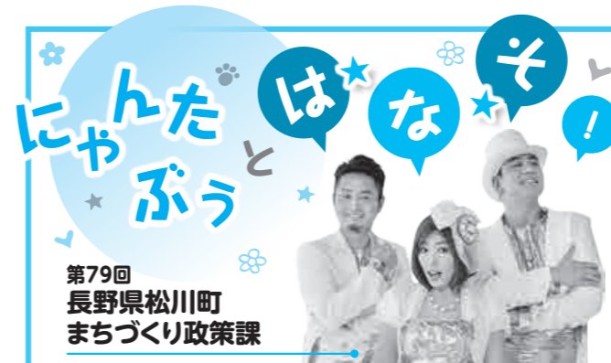
第79回 長野県松川町 まちづくり政策課

日本産業規格(JIS)などの安全基準に適合したマークが付いている製品でも、扉のロックを完全に掛けなければ事故が発生する可能性があります。扉には常にロックを掛け、開け閉めする際は、扉を手で引っ張るなどして、収納部分の扉のロックが掛かっていることを必ず確認しましょう。収納部分の上枠と扉をひもで縛るなど、簡単に開かないようにする工夫も有効です。収納部分の扉のロックが壊れていたら、すぐにベビーベッドの使用を中止してください。