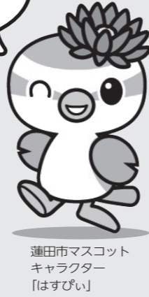
蓮田市マスコットキャラクター「はすびい」