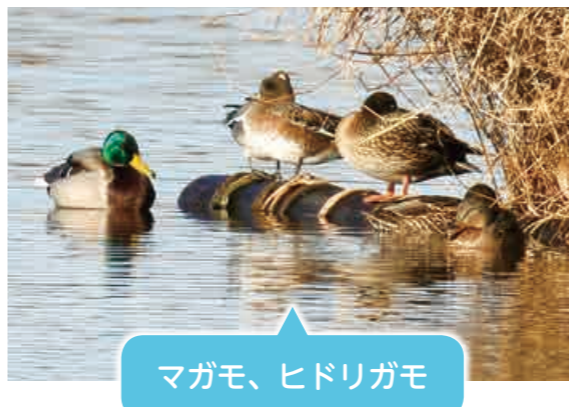
マガモ、ヒドリガモ