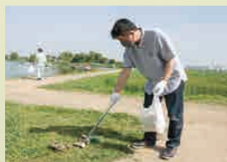
ごみの仕分け作業