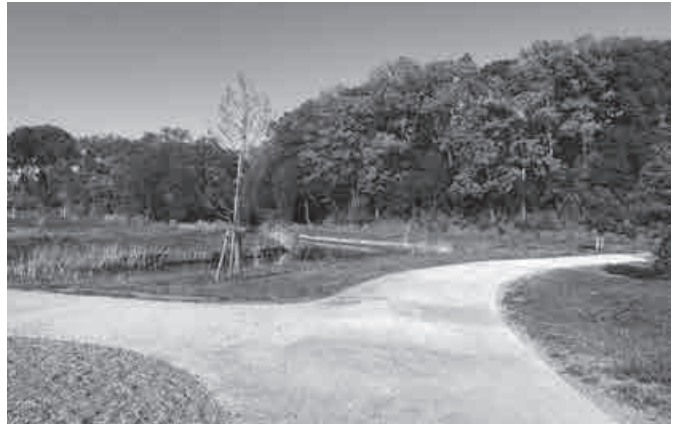
▲舗装イメージ（令和2年度整備）