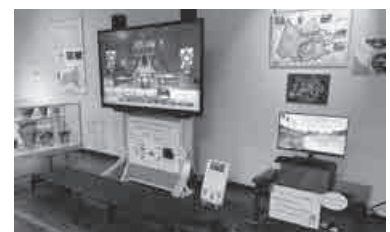
▲ガイドスモニターとVRゴーグル