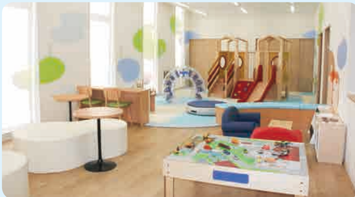
蓮田駅西口行政センター子育てサポートコーナー 「プレックス・キッズ」子育てひろば