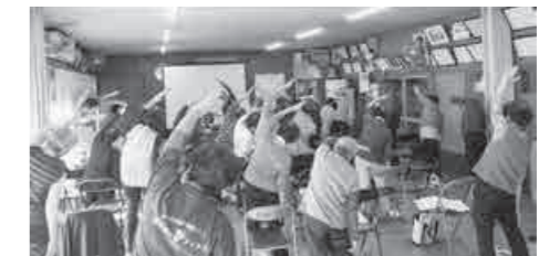
活動の風景① 児童の登下校時の見守り活動 活動の風景② はすぴい元気体操

このような活動を通し、安心・安全なまちづくりを目指しています！ 加入方法等、自治会に関するご質問は、自治振興課または地域の自治会長・役員にお問い合わせください。