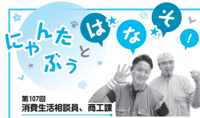
第107回 消費生活相談員、商工課

いわゆる「サポート詐欺」に関する相談が、多く寄せられています。警告画面が表示されても、まずは疑い、表示されている連絡先に電話しないようにしましょう。また、警告画面や警告音が出て慌てず、自分でパソコン等の状態を確認するか、周りの人や消費生活センター等へ相談しましょう。