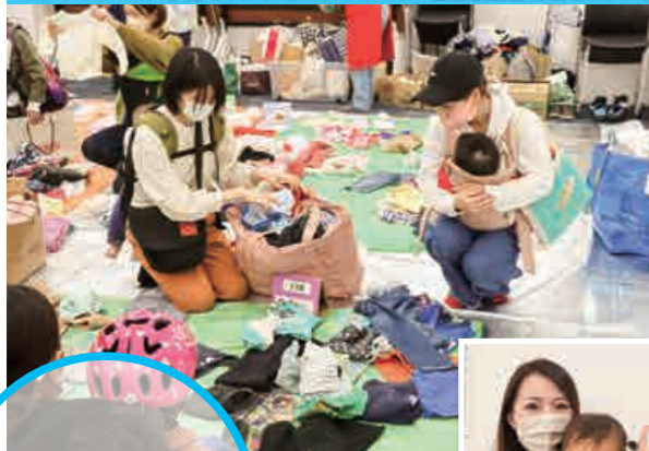
ゆずりっこWith子育てコンシェルジュ (11/22・蓮田駅西口行政センター)