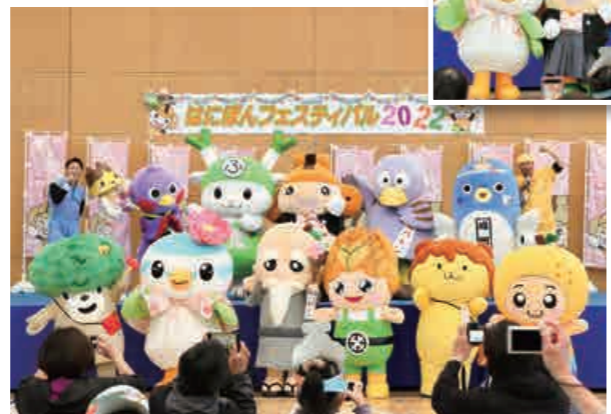
はにぼんフェスティバル2022 (11/19・カミケンシルクドーム)