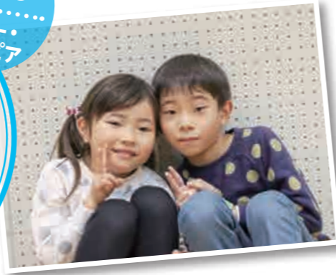
令和4年度蓮田市消防特別点検 (11/13・パルシー)