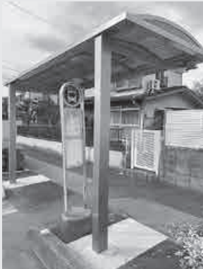
西城沼公園バス停留所