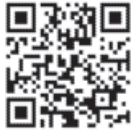
人間総合科学大学 ホームページ

申込み・問合せ 5月22日(水)までに、講座名・氏名・住所・電話番号・参加人数・この講座を知ったきっかけを同校ホームページまたはメール (records@human.ac.jp)、電話で、人間総合科学大学 ☎ 749-6111へ