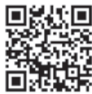
地方税お支払サイト

5月は自動車税の納期です。コンビニエンスストア窓口での納付の他、スマートフォン決済アプリによる納付や地方税お支払いサイトからクレジットカードやインターネットバンキングを利用した納付が可能です。