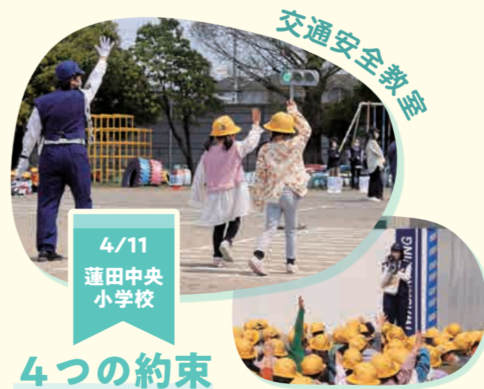
4/11 蓮田中央 小学校