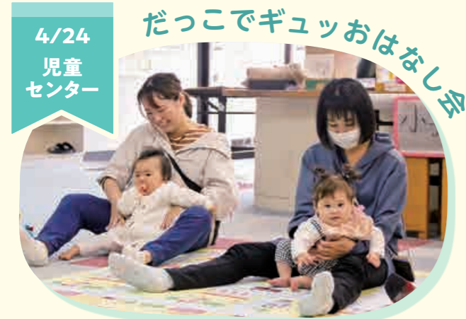
4/24 児童 センター