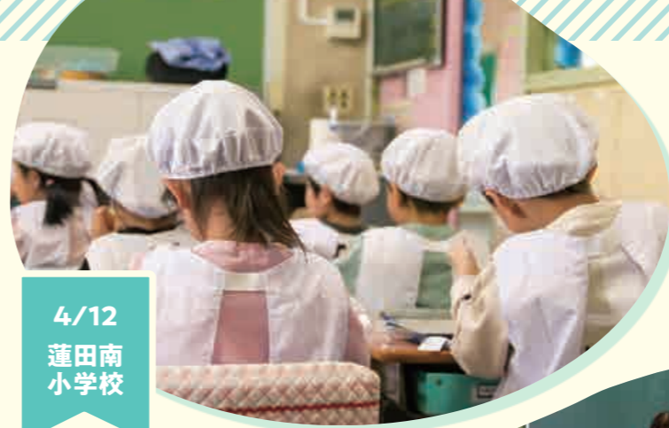
4/12 蓮田南 小学校