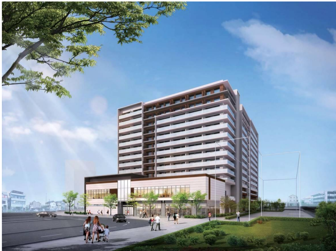
駅前広場側から見たイメージ

※事業概要及びイメージは現時点の計画です。今後の詳細設計に伴い、変更の可能性があります。