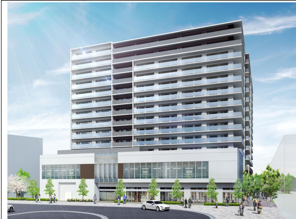
駅前広場側からの外観イメージ

※事業提案の概要は現時点の計画です。今後の詳細設計に伴い、変更の可能性があります。