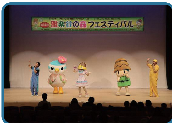
●うたやの森フェスティバル