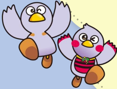
埼玉県マスコット「コバン」[さいたまっち]