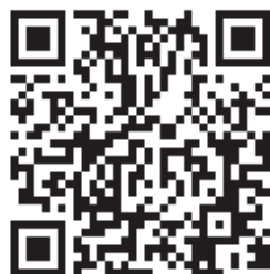
救急車利用リーフレット