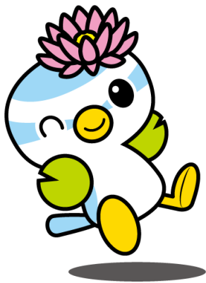
蓮田市マスコットキャラクター はずぴい

いろいろな知識や技術、豊富な体験・経験をお持ちの方、 人材バンクに登録して、地域の活動に役立ててみませんか？ 興味のある方は、蓮田市 HP からご登録ください。