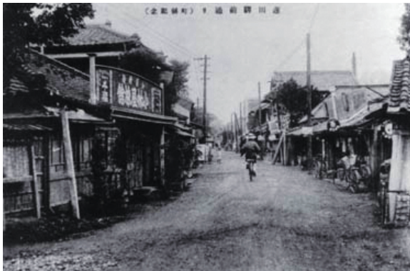
西口駅前風景 (昭和9年)

しゃしん えき この 写真は はすだ 駅 ができてから 50 年くらい たった 駅まえの ようす なのよ!